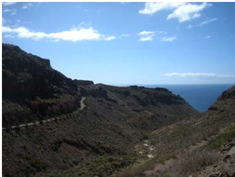
Trädkantad slingerväg runt öde dal

I stort sett har man bra vägar på Gran Canaria men här på västsidan blir det en del svängande runt bergen för bilarna. Här i Puerto Mogán går det en serpentinväg upp på berget västerut, som sedan slingrar sig fram mellan bergsknallarna för att sluta i en ny serpentin ned i nästa riktiga dal. Denna väg byggdes för ca tio år sedan men projektet stannade av så någon asfalt kom aldrig på vägbanan och någon byggnation i nästa dal blev inte av. Däremot byggde man fina murar, planterade palmer och buskar med bevattningssystem och liknande längs vägen.