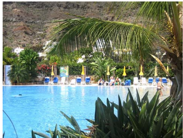
Vid poolen på det fina Cordialhotellet

Dessutom kom Bosses syster och svåger ner hit en vecka. Härligt med besök hemifrån så mycket umgänge blev det och vi fick åter vara turister ett par dagar uppe på det fina Cordialhotellet och ligga vid deras pool. Trots att vi nu varit ute i nästan tio månader lyckades vi en dag bränna oss i solen! Säger nog mer om hur lite vi är i solen än om vädret.