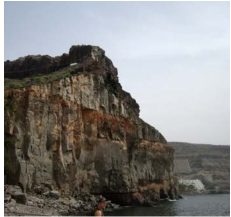
90-graderskurvan högt över Mogán (vit lastbil)