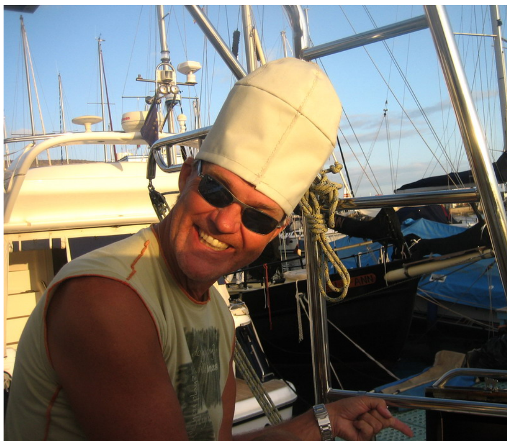
Grillmästare ombord på seaQwest